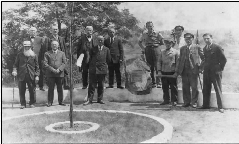
Befreiungslinde gepflanzt nach der Rückgliederung. Im Hindergrund der Gedenkstein.