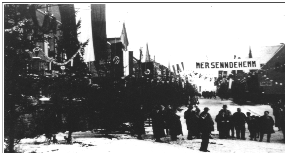
Die Litzmannstraße (heute Bergstraße) feiert mit Spruchband und Fahnschmuck.

Nach der überwältigenden Mehrheit der Saarabstimmung am 13.01.1935 für die Rückkehr des Saargebietes an das Deutsche Reich, 90,73 % stimmten für den Anschluss, 040 % für Frankreich und 8,87 % für den Status Quo, begannen sofort die Vorbereitungen für große Festivitäten in Wellesweiler. Bereits im Januar 1935 begannen Veranstaltungen, die von der Fahnenweihe der Ortsgruppe des Verbandes Deutscher Rundfunkteilnehmer bis hin zur Horst-Wessel-Gedächtnisfeier im Saale Hoppstädter reichten. Auch die Übergabe eines Rundfunkgerätes an einen „leidenden Volksgenossen“ wurde mit gebührender Aufmerksamkeit durch die Presse bedacht.