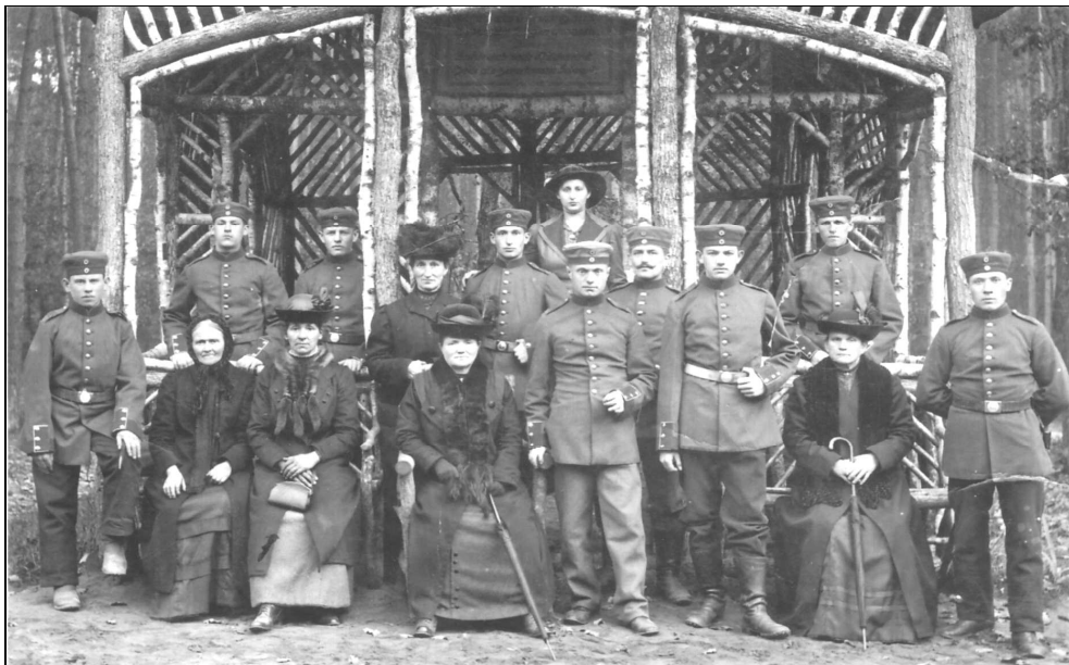
Mütter aus Wellesweiler begleiten ihre Söhne zu Ersatz Depot Bitsch