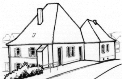
Junkerhaus, Eisenbahnstr. 22

30 Jahre Bestehen des Wellesweiler Arbeitskreis für Geschichte, Landeskunde und Volkskultur e.V.